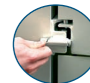
Ausführung ab 5 Fächern mit Einzelsicherung je Fach