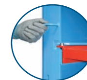
Ausführung bis 4 Fächer mit Sicherungsschieber

Auf Wunsch: Bieten wir Ihnen die Regale in verschiedenen Sonderausführungen an - bitte sprechen Sie uns an.